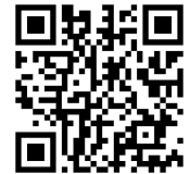
Visita virtual a las obras

Las reservas de plazas para poder visitar las obras ya terminadas deberán realizarse a través del número de teléfono 635 716 292 del 3 al 5 de noviembre de 18:30 a 20:30 horas, o hasta completar el aforo de los grupos, recordando a nuestros hermanos que el número de integrantes de los grupos es limitado.