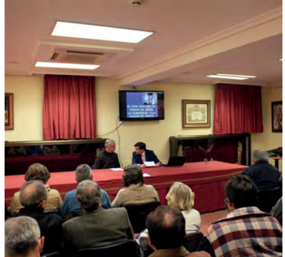
Sevilla y miembros del movimiento de cursillos de cristiandad.