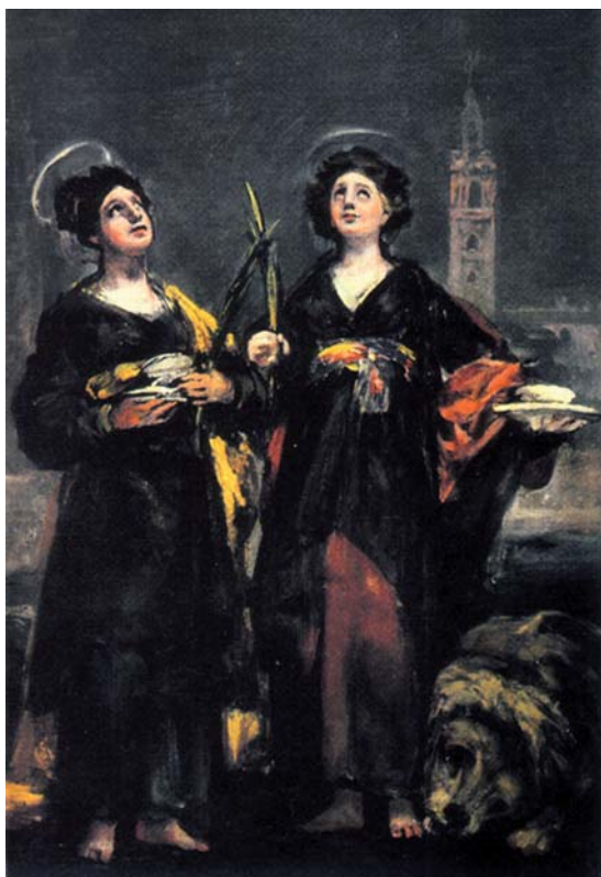
Pintura: Boceto de Goya

El 17 de Julio, día de su Festividad a las 9 de la noche esta