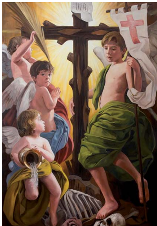
Pintura: Raul Berzosa

a las 9 de la noche Función Solemne e inicio del curso